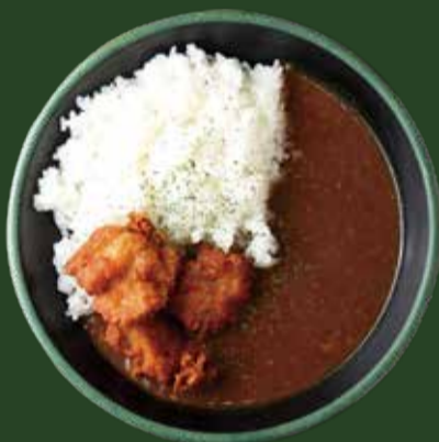
スパイシーカレー & 唐揚げ ¥1400 【ライス付】 SPICY CURRY & FRIED CHICKEN with Rice