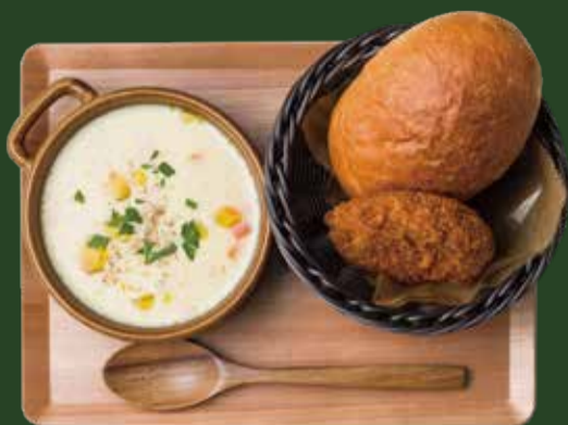
クラムチャウダー ¥1000 【パン&コロケ付】 CLAM CHOWDER with Bread & Croquette