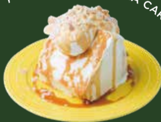
エンゼルフードケーキ バニラキャラメル ¥700

ふわふわの生地にたっぷりのクリーム。 キャラメルソースと一緒に！ Plenty of cream on fluffy dough. With caramel sauce!