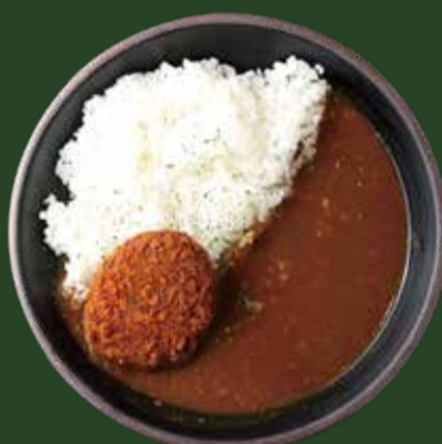
スパイシーカレー & コロケ ¥1400 【ライス付】 SPICY CURRY & CROQUETTE with Rice