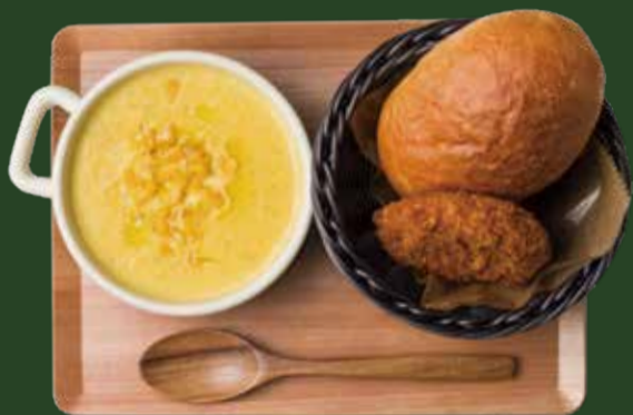
焼きとうもろこしのコーンポタージュ ¥1000 【パン&コロケ付】 CORN POTAGE OF BAKED CORN with Bread & Croquette