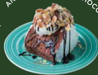
エンゼルフードケーキ ショコラ ¥700

ココアをねりこんだ生地に チョコレートとアーモンド、たっぷりクリーム。 Cocoa dough cake. Chocolate, almonds and plenty of cream.